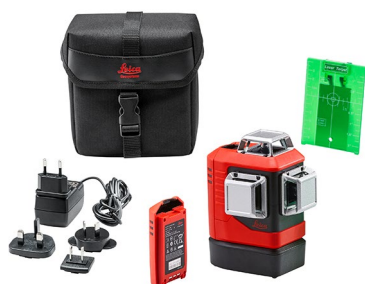
Leica Lino L6Gs Art. No. 918977

Leica Lino L6G, Li-Ion バッテリーパック, charger for Li-Ion バッテリーパック用チャージャー, アルカリ乾電池用バッテリートレイ, ターゲットプレート, クイックスタートガイド, Calibration Certificate Blue, ポーチ