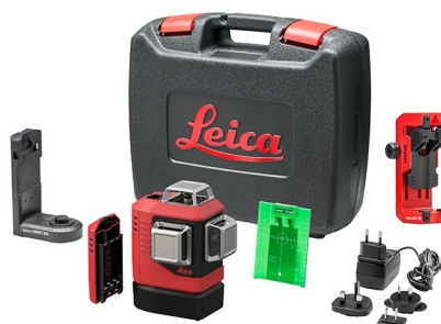
Leica Lino L6G Art. No. 912971

Leica Lino L6G, Li-Ion バッテリーパック, charger for Li-Ion バッテリーパック用チャージャー, アルカリ乾電池用バッテリートレイ, ターゲットプレート, クイックスタートガイド, Calibration Certificate Blue, ポーチ