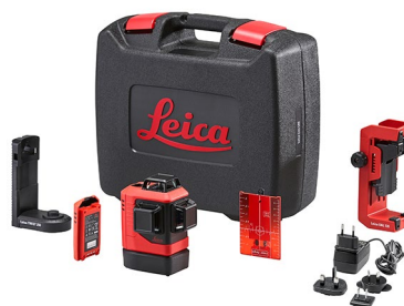
Leica Lino L6R Réf. 912969

Leica Lino L6R, logement pour piles alcalines, 3 piles alcalines AA, plaque de mire, manuel abrégé, certificat de calibrage Blue, étui