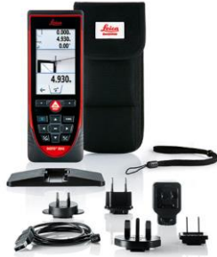
Leica DISTO™ S910 Réf. 805080 Réf. 808183 pour les États-Unis

Leica DISTO™ S910 touch, étui, adaptateur pour mesures dans les coins, support pour Smart Base, dragonne, chargeur USB, certificat de calibration Silver, manuel abrégé