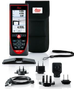
Leica DISTO™ S910 Art. n° 805080

Leica DISTO™ S910, custodia, adattatore per misurazioni angolari, piastra segnale per Smart Base, laccetto da polso, caricabatterie USB, Certificato di calibratura Silver, guida rapida