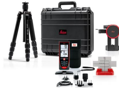
Pacchetto P2P Leica DISTO™ S910 Art. n° 887900

Leica DISTO™ S910, custodia, adattatore per misurazioni angolari, piastra segnale per Smart Base, laccetto da polso, caricabatterie USB, Certificato di calibratura Silver, guida rapida